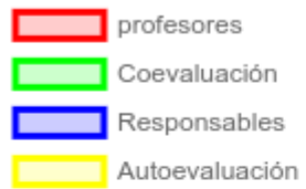
Tipo de evaluación